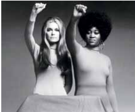
Feminismes negres. Gloria Steinem i Dorothy Pittman-Hughes (1972)

Aquesta visió reduccionista i discriminatòria ha estat fortament criticada per part de les excloses, no blanques (per una antologia en castellà, vegeu Jabardo, 2012), pobres, sense veu, marginalitzades, minoritzades, lesbianes i decolonials (per una antologia en castellà, vegeu Suárez, Henández, 2008). Podem trobar una de les primeres crítiques al "movim blanc de dones" per no reconèixer binarismes més enllà del gènere en un article de Frances Bale del 1970 (Sandoval, 2000). Una altra famosa presa de posició és la del The Combaheer River Collective (1977-1997), que no només denuncia el racisme present en les feministes, sinó que aposta per la creació de col·lectius de feministes negres. Pocs anys després veu la llum el llibre amb el explícit títol de Totes les dones són blanques, tots els negres són homes però algunes de