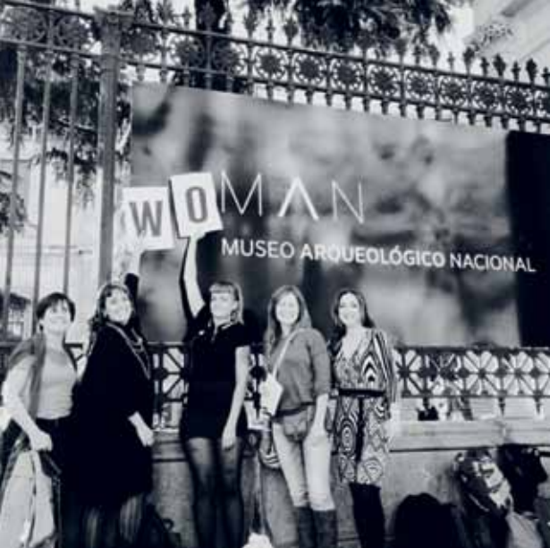
Womanising al MAN. Fotografia: Jesús Martín Alonso (29/10/2016)

tat en la història. 24 Altres van apostar per la producció/exposició i performances en ambients no institucionals, i subvertir les mateixes regles del que pot ser considerat artístic.