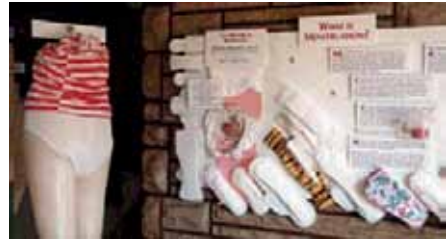
El museu de la menstruació (MUM, Maryland, EUA)

gut de l'art ha estat masculinitzat i aposten per la recuperació i valoració d'altres elements culturals associats a la feminitat o a l'experiència vital de les dones.