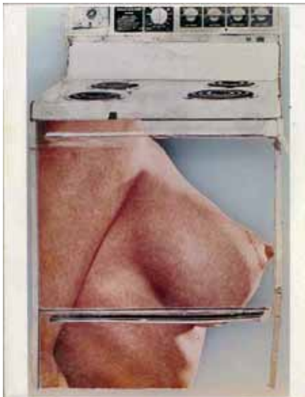
Martha Rosler. Hot Meat, Body beautiful, or beauty knows no pain series

La negació de les potencialitats de les dones com a subjectes de producció de coneixement i l'ocultació de la nostra autoria creadora han estat presents en tots els àm-