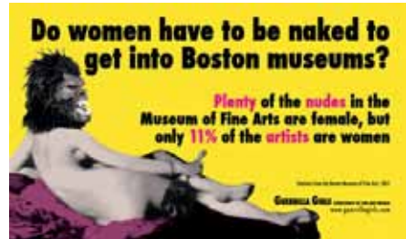
"Do women have to be naked to get into Boston Museums?" Guerrilla Girls (1989)

A la denúncia pública hi van seguir peticions i pressions per aconseguir que més artistes poguessin presentar les seves obres als museus (de la mateixa manera que en els espais científics es va reivindicar, i es continua reivindicant, una major presència de dones). Altres feministes van anar més enllà criticant que el mateix concepte que s'ha tin-