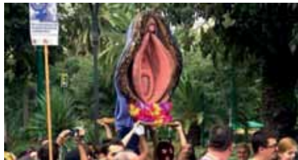
Processó del Cony insubmís (Sevilla, 2014)

més enllà dels controls dels policies pancartes, esprais i altres materials necessaris per a l'acció directa. 16 En aquest sentit, encara que de manera més articulada, funcionen també les pràctiques d'aquells col·lectius que fan servir la performance Femm com a eina per atraure l'atenció de ciutadans apàtics. Així, per exemple, les experiències del col·lectiu Pink Bloque (Bloc Rosa), de Chicago, 17 que en les seves actuacions al carrer usen colors i vestits "femenins" per semblar innòcues i facilitar que la gent s'acosti a elles i escoltin el seu missatge polític. "Amb aquesta finalitat, les membres de grup activista implementen una estratègia comunicativa que anomenen flirteig tàctic : consisteix en l'escolta activa i a quedar-se tranquil·les i gràcils, tot i que les persones amb qui parlen no ho estiguin" (Grisard, Biglia, 2015). A través d'aquesta pràctica, que pot esdevenir una arma de doble tall, com analitzem en l'esmentat article, les activistes performen els estereotips de gènere per obtenir més impacte en l'activisme mateix. Un altre controvertit grup que intenta atreure l'atenció mostrant els pits en les seves accions són les controvertides Femen, que són, però, àmpliament criticades en espais feministes no només per la instrumentalització d'uns cossos generalment normatius, sinó, sobretot, per l'actitud colonialista i racista en unes quantes intervencions seves (vegeu, per exemple, O'Keefe, 2014; Natalie, 2015).