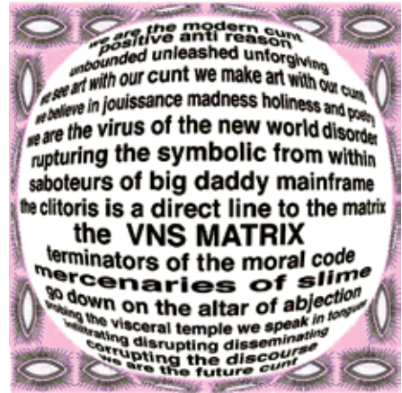
VNS Matrix, Manifest ciberfeminista per al segle XXI (1991)

Paradoxalment, una performance semblant és usada com a eina subversiva a través dels tallers Drag King i Drag Queen, en què les participants estan convidades a performar (en espais privats o en llocs públics) el gènere al qual, teòricament, no estan inscrites. Permetrien tenir una experiència corporificada de la performativitat de gènere i entendre com les normes ens guien en la nostra quotidianitat. Facilitaria, a més, experimentar les