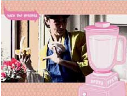
Hack the gender. Sexy Shock (2005) (CC)

Shock, que, pel Mayday del 2005, treu una sèrie d'imatges en què denuncia clarament les tecnologies de gènere i el control social que comporten a través de missatges que en subverteixen l'ús estereotipat, i declaren a més, amb una clara referència al cyberfeminisme, "hack the gender"!